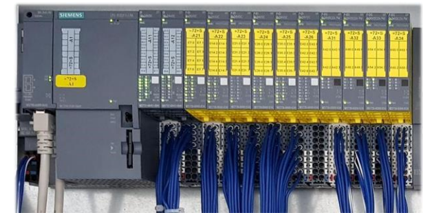
Sicherheit durch Safety-SPS