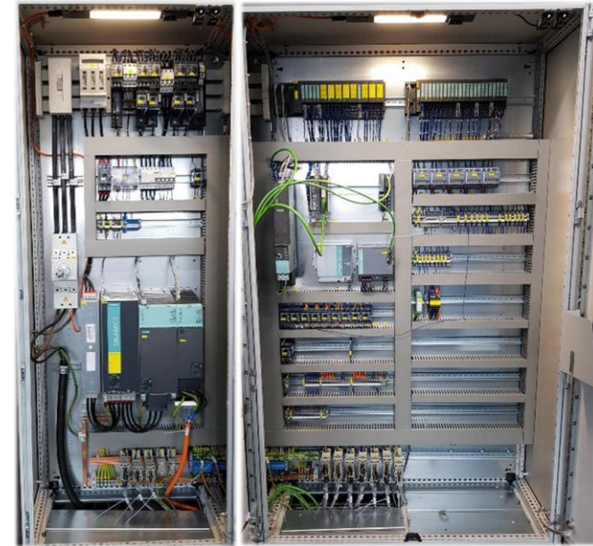
Aktuellste Technik im Schaltschrank