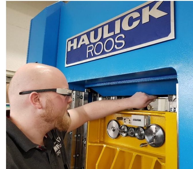
Einsatz der Datenbrille